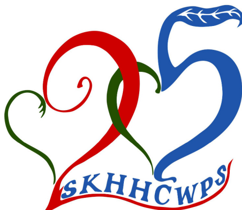
雙冠軍作品合併後的圖案

紅色代表耶穌犧牲的寶血，紅心代表基督無私的愛；藍色代表聖公會何澤芸小學，藍心代表校內教職員對學生無微不至的愛；兩心相扣，以紅藍線條帶出 25 數字，代表校內持份者偕同基督，堅·信·愛同行已 25 載；綠色代表從愛孕育出的生命力，當中長出綠苗及藍葉，更寓意愛已轉化，在教育路上發熱發光。